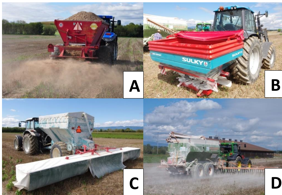
Fig. 4 : (A) Une chaux des gravières peut être appliquée avec une épandeuse à disque spécialisée. (B) L'épandage à l'aide d'un semoir à engrais pour la chaux sous forme de granulés. (C) Chaux d'Aarberg épandue à l'aide d'une rampe spécialisée additionnée d'une bâche de protection afin de diminuer la poussière. (D) L'épandeuse à rampe spécialisée avec pendillard permet d'appliquer les produits en poudre au plus près du sol afin de limiter les pertes.

La mécanisation idéale dépend du produit choisi. Pour l'épandage de la Chaux d'Aarberg, un épandeur à disque est avantageux. Des produits granulés disponibles en sacs et big bags peuvent être épandus avec le semoir à engrais.